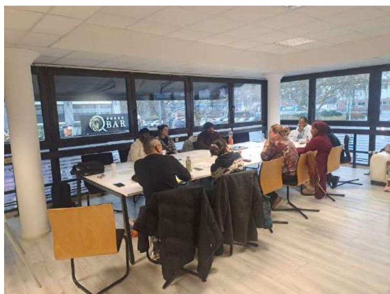
Rollenspiele „Game Changer“