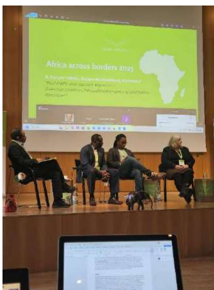
Africa across Borders, Karlsruhe, (18. Oktober)