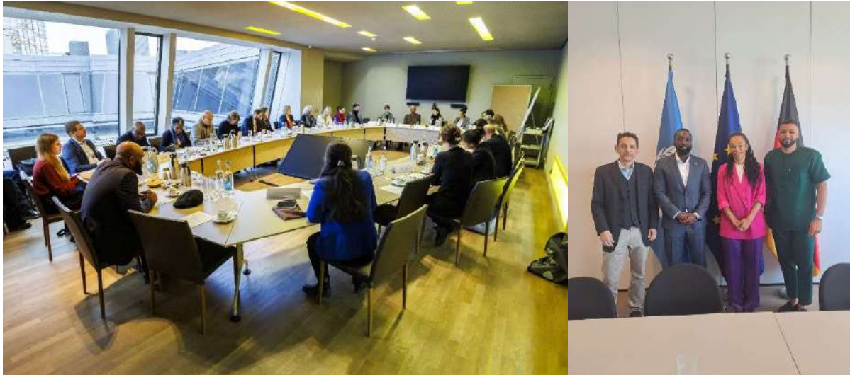
Dritter Entwicklungspolitischer Dialog, Berlin (2. Dezember, Bild links)