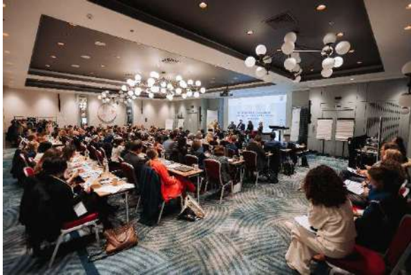
EU LMPN Konferenz, Brüssel, 18. November

mündet die Umsetzung in unüberschaubaren Verwaltungsprozessen. Diese erzwingen eine ressourcenintensive Einzelfallbetreuung, was die eigentlich angestrebte Skalierbarkeit der Modelle massiv erschwert.