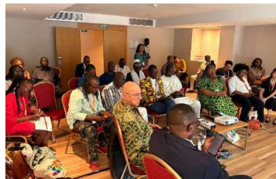
Side Event zur Rolle der afrikanischen Diaspora in der Finanzierung von Entwicklungsvorhaben, Sevilla (2. Juli)

Die aktuelle Landschaft der internationalen Zusammenarbeit ist von einer tiefgreifenden Zäsur geprägt. Angesichts stagnierender oder sinkender Mittel für die öffentliche Entwicklungszusammenarbeit (Official Development Assistance, ODA) – verschärft durch die Auflösung von USAID im Juli 2025 – setzen staatliche Institutionen verstärkt auf die Mobilisierung privater Kapitalströme. Die Konferenz in Sevilla verdeutlichte jedoch, dass die notwendigen Rahmenbedingungen für ein solches Engagement oft noch nicht gegeben sind.