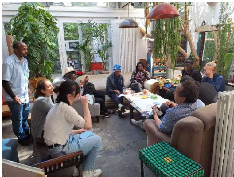
Workshopreihe "Game Changers", Café Swane, Wuppertal (11. Mai)