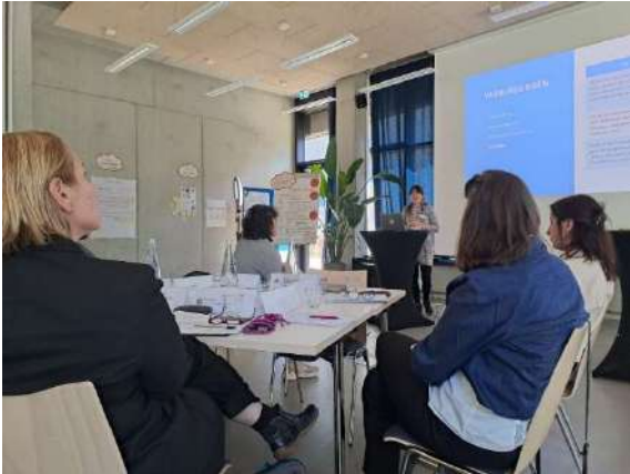
EMPDIV, Workshop