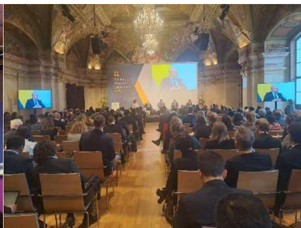
Vienna Migration Conference, Wien (21. Oktober)

Im Jahresverlauf veranstaltete das EU LMPN digitale Fachaustausche zu folgenden Themen, „Advancing Talent Partnerships: Policy and Operational Updates with the EU Commission“ (30. Januar), “Showcasing 2024-awarded MPF projects: Strategic Insights and Priorities” (13. Februar), “Promoting safe and regular migration: The role and prospects for Migrant Resource Centres in Central and South Asia” (9. Oktober).