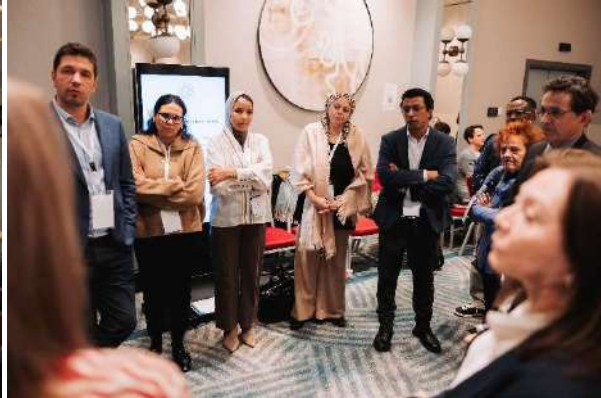
EU LMPN Konferenz, Brüssel, 18. November

Zur Überwindung dieser Herausforderungen bieten verschiedene Akteure Plattformen mit unterschiedlichen Schwerpunkten an. Das Netzwerk Internationale Migrationssozialarbeit der Diakonie (IMSA) ist in der Vorintegration in Drittländern tätig, wo es darum geht, potenzielle Auswanderer vor ihrer Reise über das Leben in Deutschland zu informieren. Die Abschlussveranstaltung dieses Projektes (10. März) und das Netzwerktreffen unter dem Thema „Vorintegration und digitale Formate“ (10. April) zeigten, wie wichtig es für potenzielle Auswanderer ist, glaub- und vertrauenswürdige Internetauftritte anzubieten.