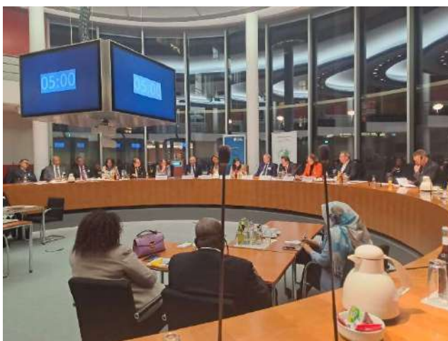
Konferenz „Die Afrikapolitik der neuen Bundesregierung – klare Strategie im geopolitischen Wettbewerb?“ (3. Dezember)

Während das Thema Dekolonisierung auf der Agenda der vorangegangenen Bundesregierung eine wichtige Stellung einnahm, ist unter der aktuellen Administration eine deutliche Prioritätenverschiebung hin zu sicherheits- und wirtschaftspolitischen Interessen festzustellen. In diesem Kontext organisierte die Deutsche Afrika Stiftung im Bundestag die Konferenz „Die Afrikapolitik der neuen Bundesregierung – klare Strategie im geopolitischen Wettbewerb?“, um den strategischen Wandel den developmentspolitischen Stakeholdern zu vermitteln. Die Veranstaltung diente auch zum Netzwerken.