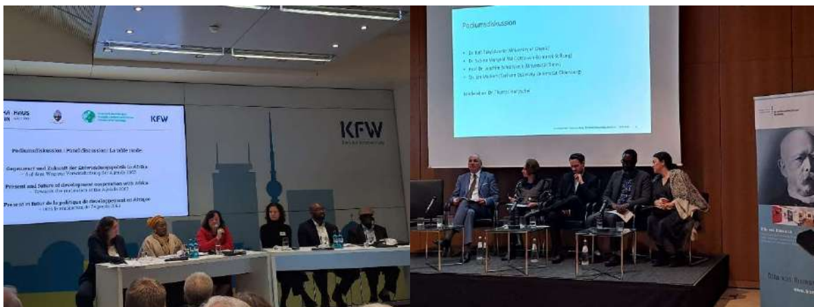
Symposium in Gedenken an 140 Jahre Berliner Konferenz 1884/85, Berlin (29. – 30. Januar, Bild links) © A.D.A.G.E. Paneldiskussion zum Sammelband „Die Berliner Afrika-Konferenz 1884/85. Impulse zu einem globalen Ereignis“ im Auswärtigen Amt (26. Februar, Bild rechts) © A.D.A.G.E.

Das Gedenken an die Berliner Afrika Konferenz (11.1884 – 02.1885) setzte sich im Jahr 2025 fort. Die Deutsche Afrika Stiftung lud Vertreter von Regierungen, Parlamenten und Zivilgesellschaft aus Afrika und Deutschland, um in verschiedenen thematischen Foren über das historische Gewissen zwischen beiden Kontinenten zu diskutieren. Das Auswärtige Amt organisierte seinerseits eine Paneldiskussion zum Sammelband „Die Berliner Afrika-Konferenz 1884/85. Impulse zu einem globalen Ereignis“. In beiden Veranstaltungen gaben Vertreter von A.D.A.G.E. Impulse in die Diskussionen. Zum selben Themenkomplex gehörte die Abschlusskonferenz des Beirats zur Umsetzung der UN-Dekade für Menschen afrikanischer Herkunft in Berlin. (21. März)