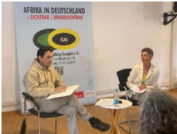
Afrika in Deutschland, Freiburg (7. Juni) GAI

und vielfältiger Perspektiven“ auch über die Erfolge und die Grenzen der bundespolitischen Arbeit von A.D.A.G.E.