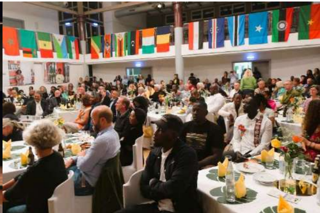
Africa Week, Freiburg (26. September) ©GAI