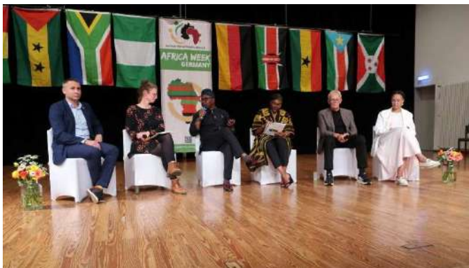
Africa Week, Freiburg (26. September)