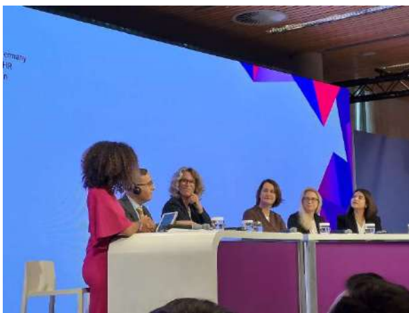
Fachkräftekongress, Berlin (25 Februar)

Im Rahmen des Wissensmanagements beteiligten sich Vertreter von A.D.A.G.E. an zahlreichen Fachkonferenzen und Workshops zur internationalen Arbeitsmobilität aus Drittstaaten teil. Das Bundesministerium für Arbeit und Soziales (BMAS) organisierte den jährlichen Fachkräftekongress in Berlin (26. Februar), das International Centre for Migration Policy Development (ICMPD) seine jährliche Vienna Migration Conference in Wien (21. – 22. Oktober) und das EU Labour Mobility Practitioners Network (EU LMPN) seine Jahreskonferenz unter dem Motto “From lessons to levers: Driving the next phase of labour migration” in Brüssel (18. – 19. November).