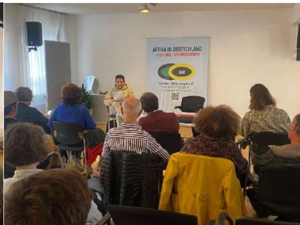
Afrika in Deutschland, Freiburg (7. Juni)