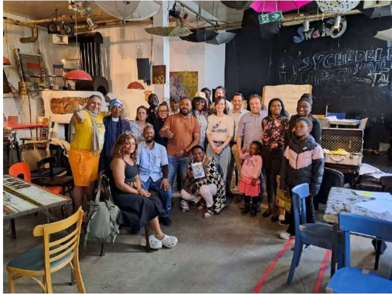
Workshopreihe "Game Changers", Café Swane, Wuppertal (11. Mai)