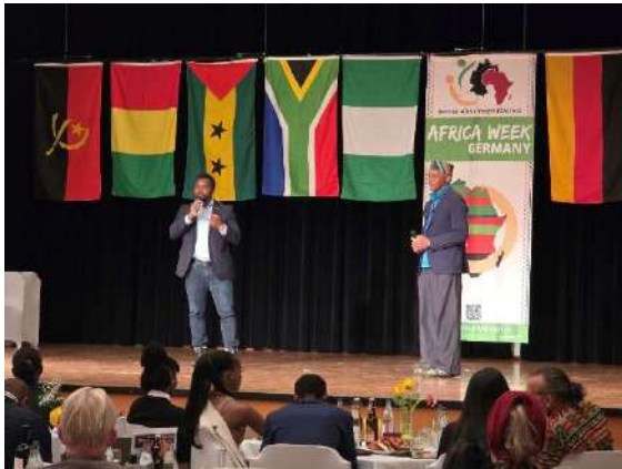
Africa Week, Freiburg (26. September)