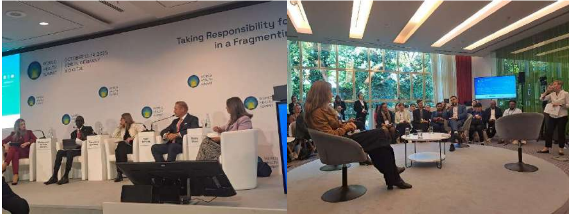
World Health Summit (13. Oktober), Berlin