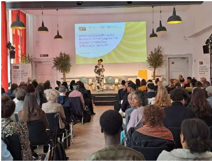
Abschlussveranstaltung des Beirats zur Umsetzung der UN-Dekade für Menschen afrikanischer Herkunft, BMBFSFJ, Berlin (21. März)

Während das Thema Dekolonisierung auf der Agenda der vorangegangenen Bundesregierung eine wichtige Stellung einnahm, ist unter der aktuellen Administration eine deutliche Prioritätenverschiebung hin zu sicherheits- und wirtschaftspolitischen Interessen festzustellen. In diesem Kontext organisierte die Deutsche Afrika Stiftung im Bundestag die Konferenz „Die Afrikapolitik der neuen Bundesregierung – klare Strategie im geopolitischen Wettbewerb?“, um den strategischen Wandel den developmentspolitischen Stakeholdern zu vermitteln. Die Veranstaltung diente auch zum Netzwerken.