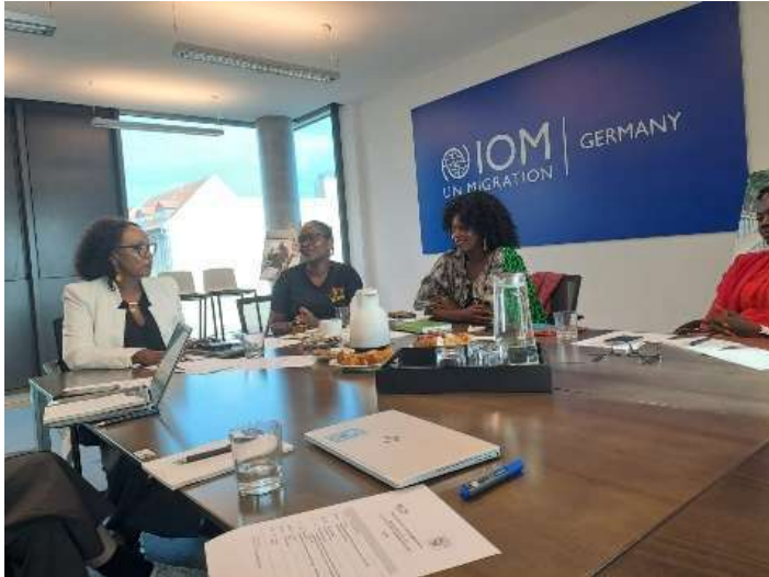
Diaspora Circle Chat, Berlin (18. September)